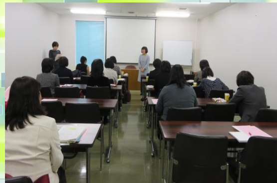
実行委員会 会長挨拶

研究協議会は、1,000人を上回る参加者をお迎えするため、役員に加え関東近県より14名の先生方の協力をいただき、実行委員会を組織しています。また、当日は運営委員として20名の先生方、ボランティアとして養成大学学生にも、ご協力をいただきます。実行委員会では、施設や受付等の業務の役割分担を確認しました。皆様、どうぞよろしくお願いいたします。